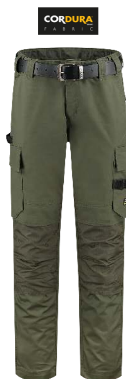
WERKBOEK TWILL CORDURA ■ 502021