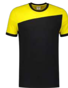
T-SHIRT BICOLOR NADEN ■ 102006

Naast een nieuwe look is de pasvorm van al onze Bicolors verbeterd. Het blijft nog steeds een zeer geschikt product om aan te laten sluiten bij de huisstijl van uw organisatie.