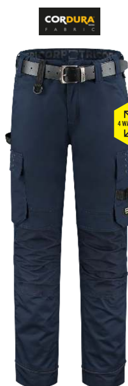
WERKBOEK TWILL CORDURA STRETCH ■ 502020