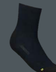
WERKSOX 2-PACK 55 GRAM ■ 602009