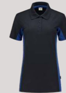
POLOSHIRT BICOLOR DAMES ■ 202003