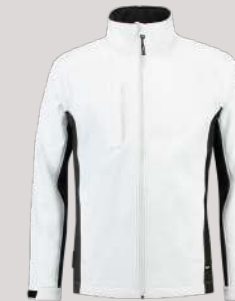
SOFTSHELL BICOLOR ■ 402002