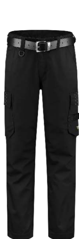
WERKBOEK TWILL DAMES ■ 502024