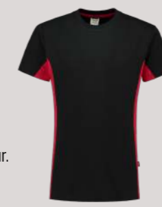
T-SHIRT BICOLOR ■ 102004

De klassieke Bicolor springt er aan de zijkant uit met een opvallende of basiskleur. Verkrijgbaar in 10 modellen en 12 kleurstellingen.