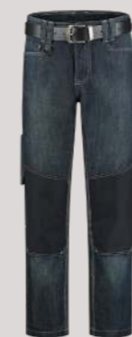
JEANS WERKBOEK ■ 502005