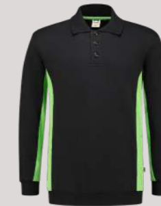
POLOSWEATER BICOLOR ■ 302003