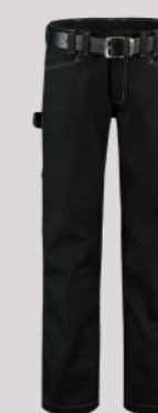
WERKBOEK CANVAS ■ 502007