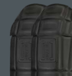
KNIEKUSSENS ■ 652002