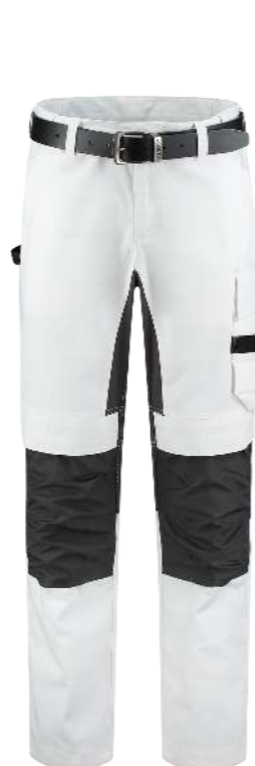
SCHILDERSBOEK TWILL CORDURA STRETCH ■ 502016