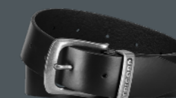
RIEM LEER ■ 652007