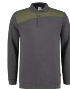
POLOSWEATER BICOLOR NADEN ■ 302004