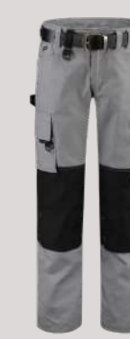
WERKBOEK CORDURA CANVAS ■ 502009