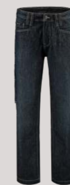
JEANS BASIS ■ 502001