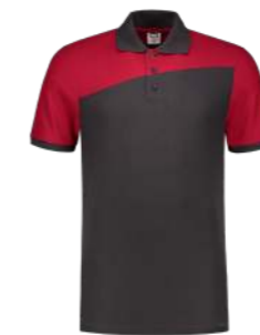
POLOSHIRT BICOLOR NADEN ■ 202006