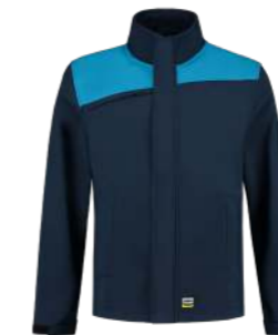
SOFTSHELL BICOLOR NADEN ■ 402021